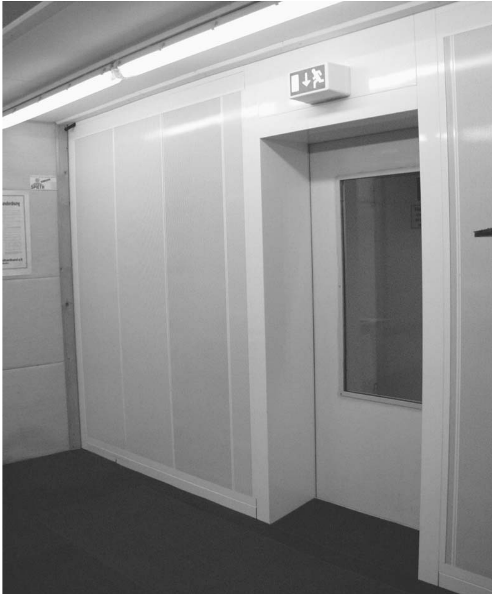
Beispiel einer Verdrängungslüftung

Seitlich neben der mittig eingebauten Zugangstüre befinden sich die Lochbleche; günstiger ist es, entweder den Zugang seitlich oder die Türleibungen als schräge Lufteinlasselemente auszuführen.